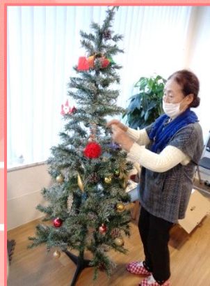
皆様とクリスマスの装飾の制作やツリーを飾りました☆