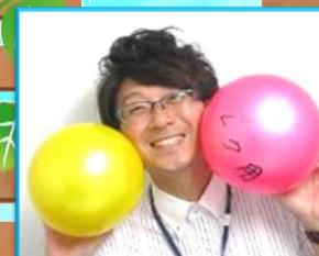
菊地事務次長 兼生活相談員