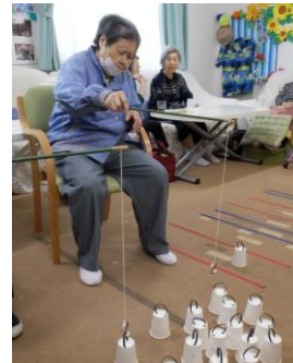
さてさて釣れるかな？