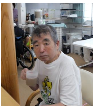
一日のスタートはコーヒーで