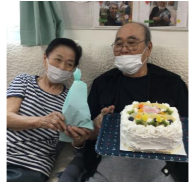
ハッピーバースディ