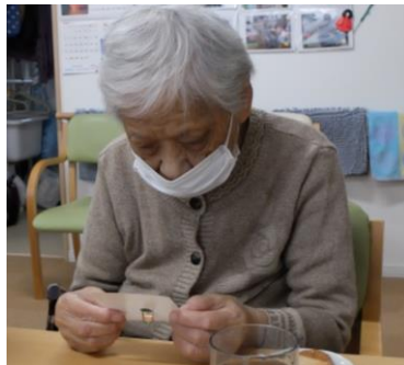
北郷の家名物ビンゴ大会