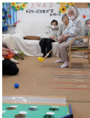
本日の賞金王は誰だ！