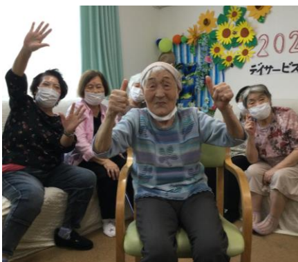
今日も元気いっぱい！