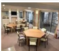
デイサービス我が家 山鼻の家 (定員18名) TEL:011-520-7107