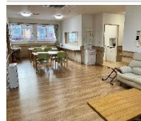
デイサービス我が家 手稲本町の家 (定員12名) TEL:011-213-9771