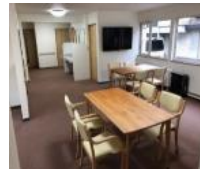
デイサービス我が家 発寒9条の家 (定員12名) TEL:011-213-8124