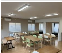
デイサービス我が家 発寒の家 (定員18名) TEL:011-688-9825