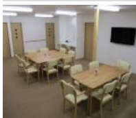
デイサービス我が家 手稲の家 (定員18名) TEL:011-215-8223