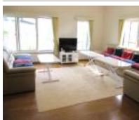
デイサービス我が家 西野の家 (定員13名) TEL:011-215-4461