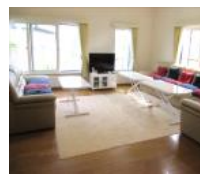
デイサービス我が家 円山公園 (定員18名) TEL:011-206-1851