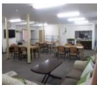
デイサービス我が家 樽川の家 (定員25名) TEL:0133-76-6900