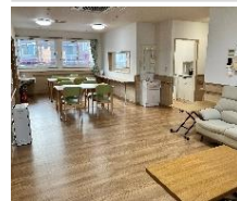
デイサービス我が家 手稲本町の家 (定員12名) TEL:011-213-9771