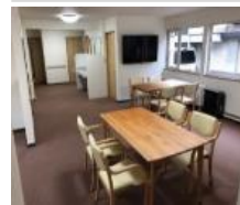
デイサービス我が家 発寒9条の家 (定員12名) TEL:011-213-8124