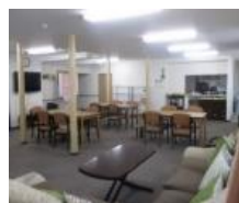
デイサービス我が家 樽川の家 (定員25名) TEL:0133-76-6900