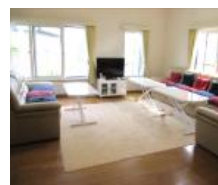
デイサービス我が家 円山公園 (定員18名) TEL:011-206-1851