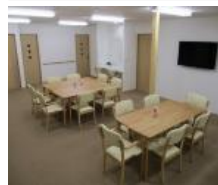
デイサービス我が家 手稲の家 (定員18名) TEL:011-215-8223