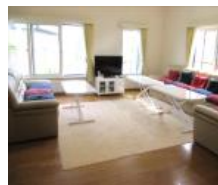
デイサービス我が家 西野の家 (定員13名) TEL:011-215-4461