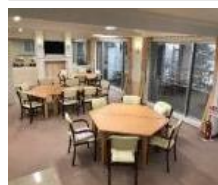
デイサービス我が家 山鼻の家 (定員18名) TEL:011-520-7107