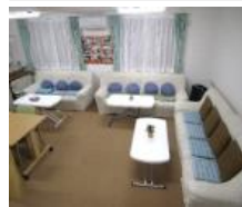
デイサービス我が家 北郷の家 (定員18名) TEL:011-598-0961