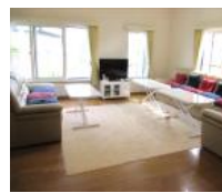
デイサービス我が家 円山公園 (定員18名) TEL:011-206-1851