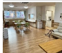
デイサービス我が家 手稲本町の家 (定員12名) TEL:011-213-9771