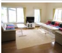
デイサービス我が家 西野の家 (定員13名) TEL:011-215-4461