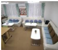
デイサービス我が家 北郷の家 (定員18名) TEL:011-598-0961