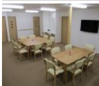
デイサービス我が家 手稲の家 (定員18名) TEL:011-215-8223