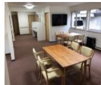
デイサービス我が家 発寒9条の家 (定員12名) TEL:011-213-8124