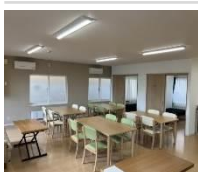
デイサービス我が家 発寒の家 (定員18名) TEL:011-688-9825