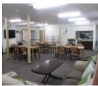
デイサービス我が家 樽川の家 (定員25名) TEL:0133-76-6900