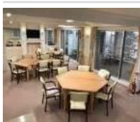
デイサービス我が家 山鼻の家 (定員18名) TEL:011-520-7107